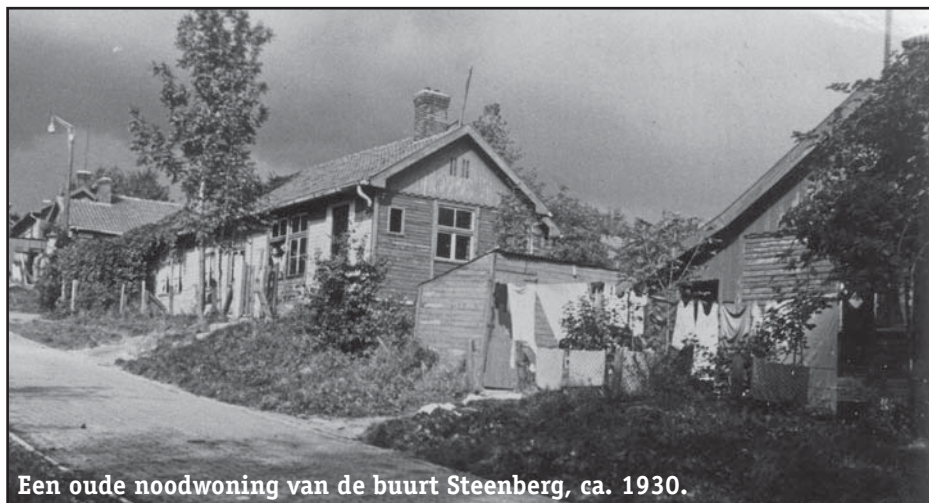
Een oude noodwoning van de buurt Steenberg, ca. 1930.

Na de Tweede Wereldoorlog moest de zielzorg door bevolkingstoename worden uitgebreid. In 1945 kwam er een noodkerkje in 'Steenberg' en bij bisschoppelijk besluit van 3 april 1948