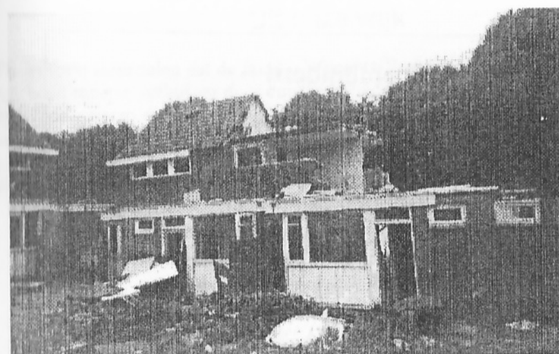
L&d projectmanagement b.v.

Al met al waren de georganiseerde uitstapjes zeer geslaagd en verheugen we ons al weer op de volgende vakantie.