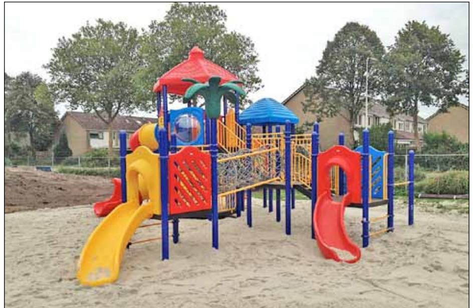
Op 22 april wordt ons nieuwe toestel geplaatst

het aantal kinderen tot en met 12 jaar wonend in dat stadsdeel.