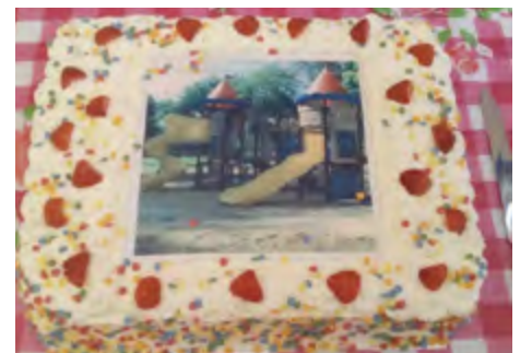
De mooie taart met het kasteel