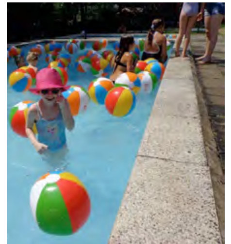
de kinderen zochten verkoeling in het zwembad