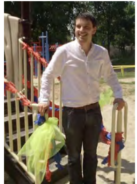
de wethouder opent ons "kasteel"