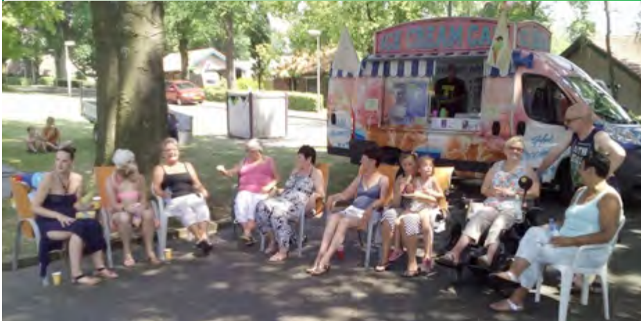
de buurtbewoners zochten de schaduw op bij de ijskar