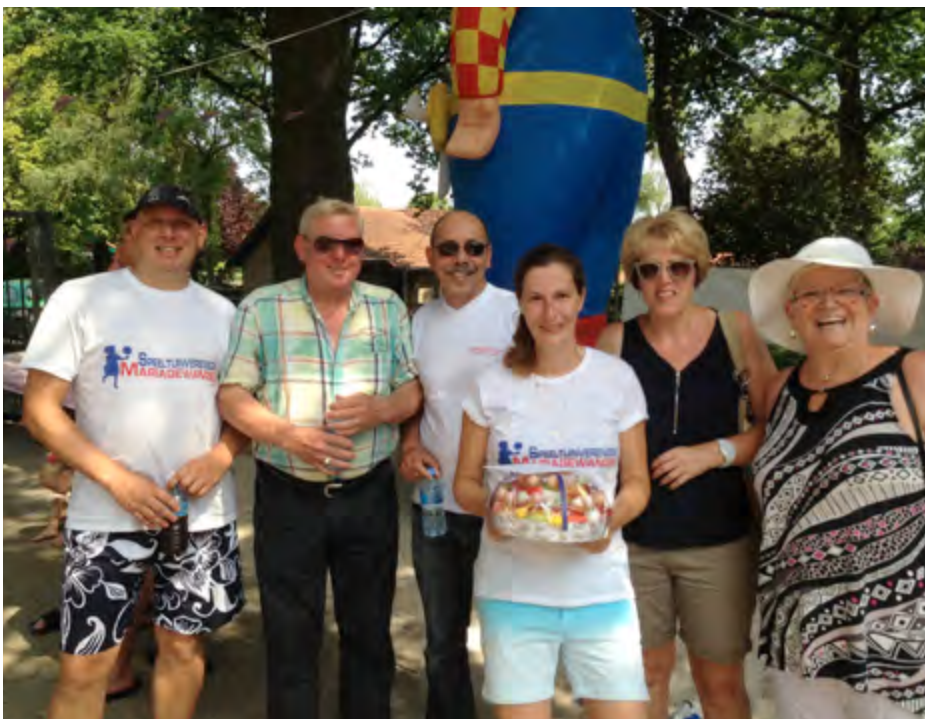
de andere hoensbroekse speeltuinen waren uiteraard van de partij