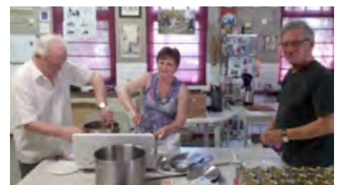
de cateraars van SBMG hard aan het werk om iedereen van eten te voorzien