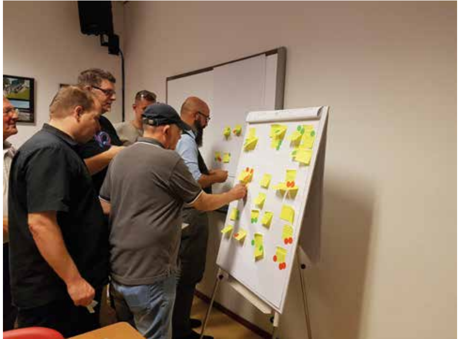
Ideeën worden verzameld en beoordeeld tijdens de informatieavond in BMV de Vlieger. Beneden de schets van het park zoals het er vanaf de zomer van 2019 uit zal gaan zien.

Bijzonder is dat het park als rustpunt opgenomen is in de plannen van de aan te leggen Leisure Lane: een fiets- en wandelpad door verschillende gemeenten in de voormalige Oostelijke Mijnstreek.