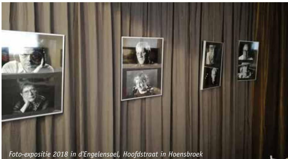
Foto-expositie 2018 in d'Engelsael, Hoofdstraat in Hoensbroek

Als je interesse hebt om mee te doen in de HAK Fotoclub, is er nog plaats voor vier fotografen. Als er zich meer mensen aanmelden, worden ze op een wachtlijst geplaatst. Voor informatie hierover kun je contact met opnemen via info@mariegawanden.nl .